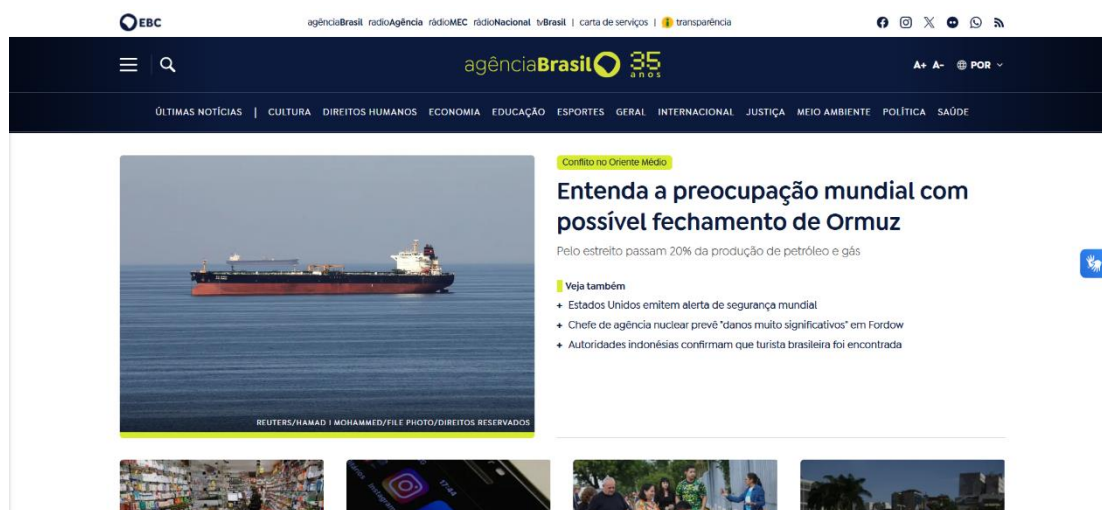
Figura 1 – Interface do site da Agência Brasil/EBC

A inexistência de uma seção permanente ou mesmo pontual voltada ao combate à desinformação pode ser interpretada como um sintoma das limitações institucionais da EBC, que enfrenta desafios recorrentes relacionados com a autonomia editorial e a instabilidade política (Nitahara & da Luz, 2021). A ausência desse investimento simbólico e editorial na EBC reduz seu potencial de diferenciação e contribuição ativa para a saúde informacional no Brasil.