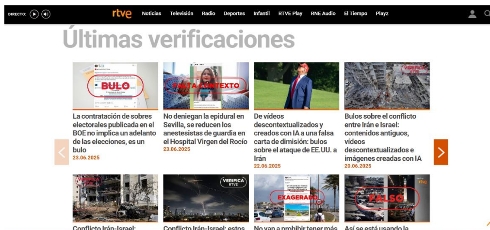
Figura 3 – Interface do site VerificaRTVE