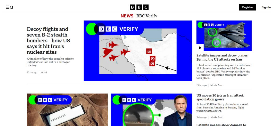
Figura 4 – Interface do site BBC Verify

Além disso, a BBC mantém parcerias com instituições acadêmicas e plataformas internacionais de verificação, além de seguir códigos editoriais próprios e rígidos que regem a transparência na apuração e publicação de conteúdos. O BBC Verify, nesse sentido, não é apenas uma marca editorial, mas um selo de credibilidade institucional, associado à missão pública do Serviço Público de Mídia de informar com precisão, independência e responsabilidade.